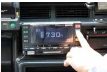
現在の東京の初乗り運賃は2kmまで730円 (2016年6月現在)