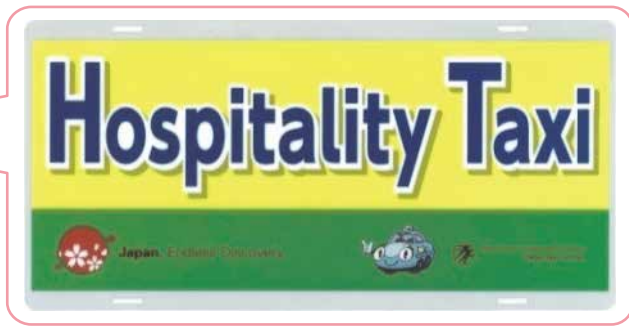
▲この表示板が目印